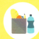
ПРОДУКТЫ ПИТАНИЯ И ВОДУ