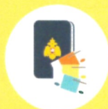
ДОКУМЕНТЫ И ДЕНЬГИ